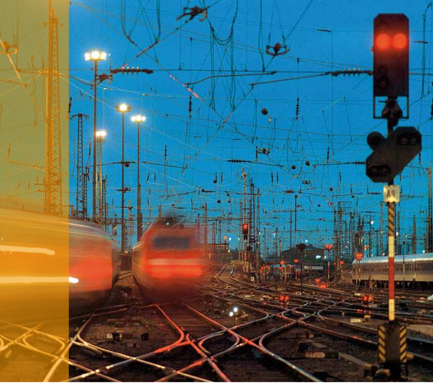
Resim: Deutsche Bahn AG/Max Lautenschlager